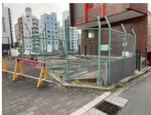
管路用地点検：南堀江 4