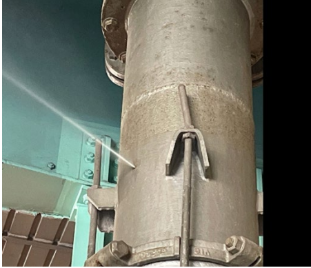
写真 突発漏水状況（中島出来島大橋）