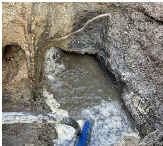
写真 突発漏水状況