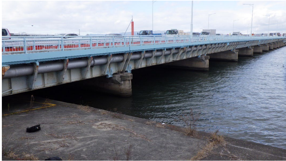
写真 水管橋調査（陸上：淀川大橋）