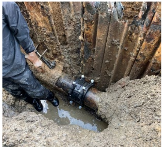
写真 漏水修繕状況