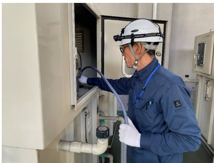
写真 維持管理作業状況