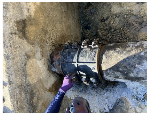
写真 漏水修繕状況