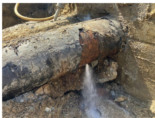
写真 突発漏水状況