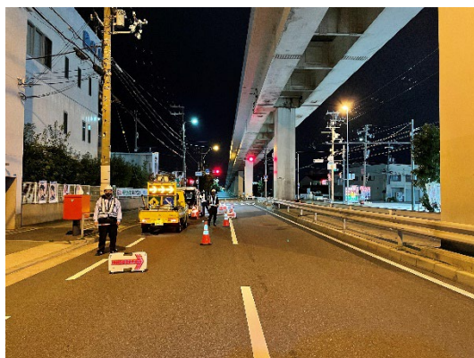
写真 交通規制状況（夜間）