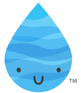
ヤサスイのロゴマーク