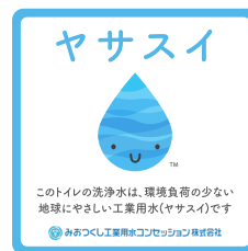
ヤサスイステッカー

「ヤサスイ」は、沈殿処理は行っていますが、飲用を目的とした水ではありません。しかし、その特性を活かせば、環境負荷の低減、そして経済的なメリット創出に大きく貢献できる可能性を秘めています。「うちの会社でももっとヤサスイを活用できないかな?」と思われるなら、ぜひお気軽にご相談ください。